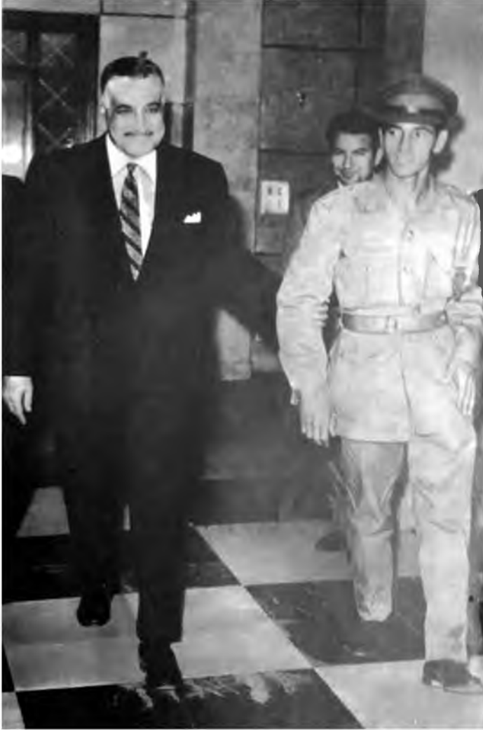
لقاء بين عبد السلام جلود وعبد الناصر في القاهرة، مصر، 1970.